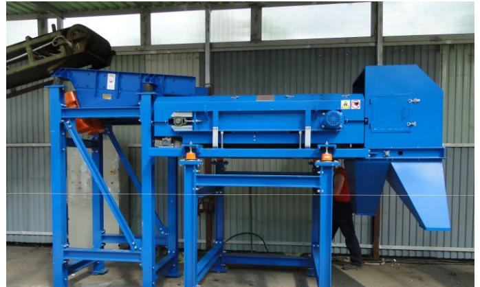
Oczyszczanie stłuczki szklanej z metali nieżelaznych.