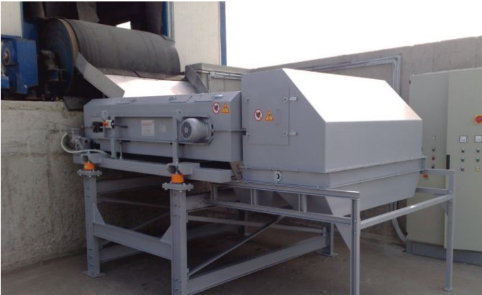
Recykling zgarów aluminiowych.