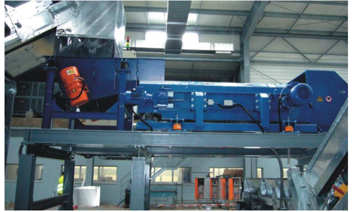
Odzysk metali nieżelaznych z odpadów elektronicznych.