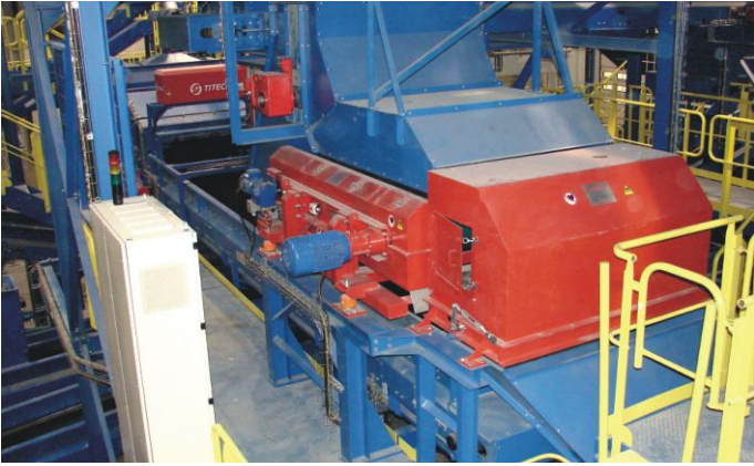
Odzysk puszek aluminiowych z odpadów komunalnych.